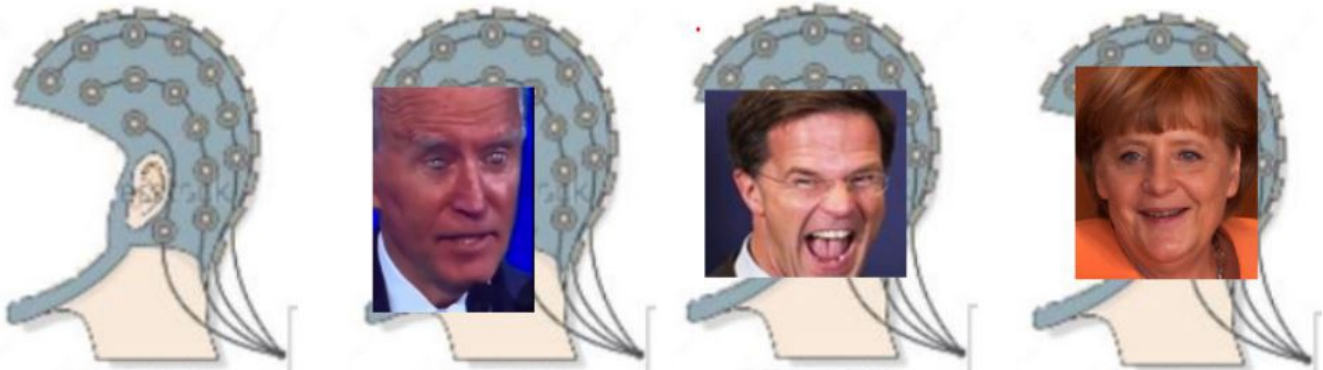
Bestudeer de lach-ziekte !

Als wij maar de kopstukken Biden, Merkel, Macron, Rutte wegens verdenking massamoord via integere politie laten oppakken en aan de TT-Test, de Truth-Test, ondervragen, iedereen maar 15 minuut, is meteen bewezen, dat ze moordenaars zijn. www.Truth-Test.jaaaa.net . Hun hersenen kunnen niet liegen. In het EEG kan men hun antwoorden zien. Moderne techniek! Heb je nog twijfels, wacht dan de test af. Wat wij al lang zien, ziet dan iedereen. Dan krijgen ze geen steun meer.