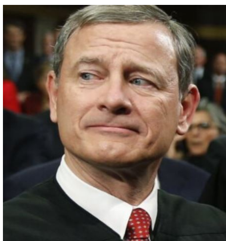
The highest judge in USA, just after having played a bad prank against Trump. Ogen naar de zijkant, lachend, mond dicht. Pppf