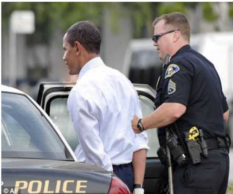
Deepstate-nut Obama arrested . Espionage for deepstate China