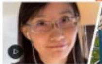
Video Chinesische Forscherin über Covid-19: 'Es kommt aus dem Labor in Wuhan' -...