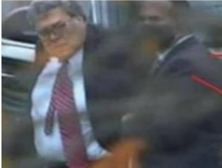
Deepstate-nut Barr arrested Trump is preparing Marshall Law