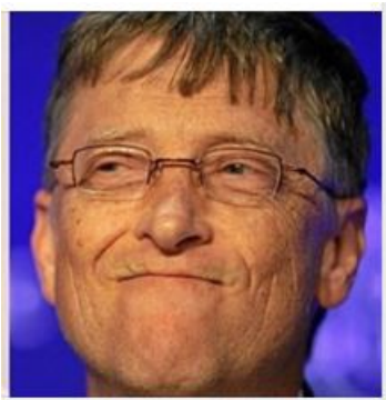
Bill Gates, playung bad pranks. Ogen naar de zijkant, lachend, mond dicht. Pppf